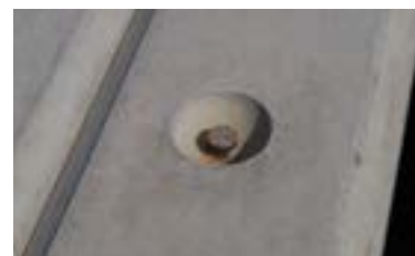
Ancre de levage de type Artéon