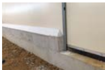
Panneaux avec passage de porte