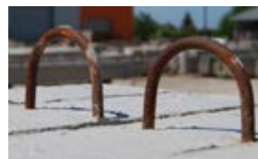
Crochet de levage dépassant