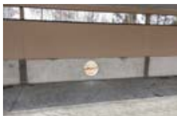
Réserve pour extracteur d'air