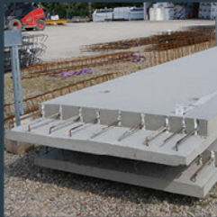
VOILE DE SOUTÈNEMENT