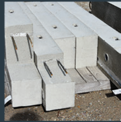
ÉLÉMENT DE RIVE, BANDEAU