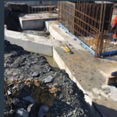
GAINE DE VENTILATION